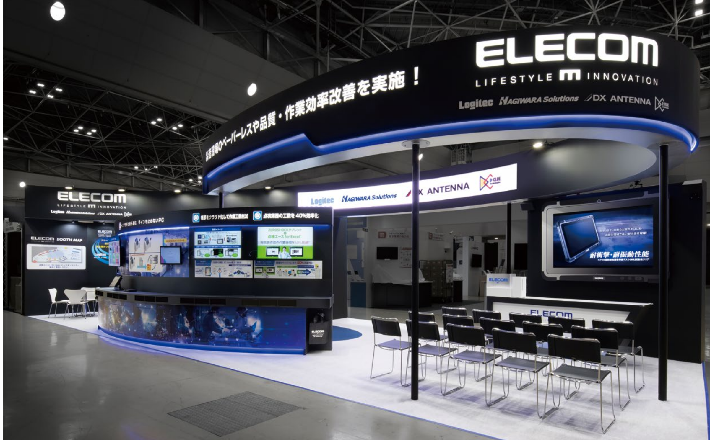
課題解決へと導く「エレコム ソリューション シップ」の新たな船出を表現

プロデュース 株式会社フジヤ / 山元 達也 ディレクション 株式会社フジヤ / 山元 達也 設計・デザイン 株式会社フジヤ / 筒井 保寿美