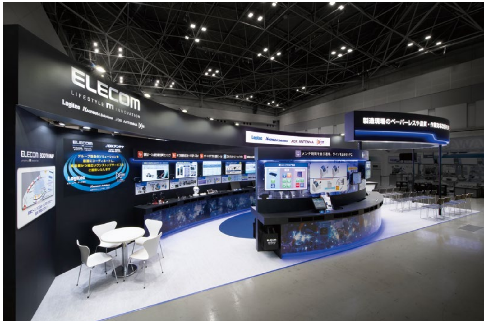
視点によりブースの印象が変化するデザイン