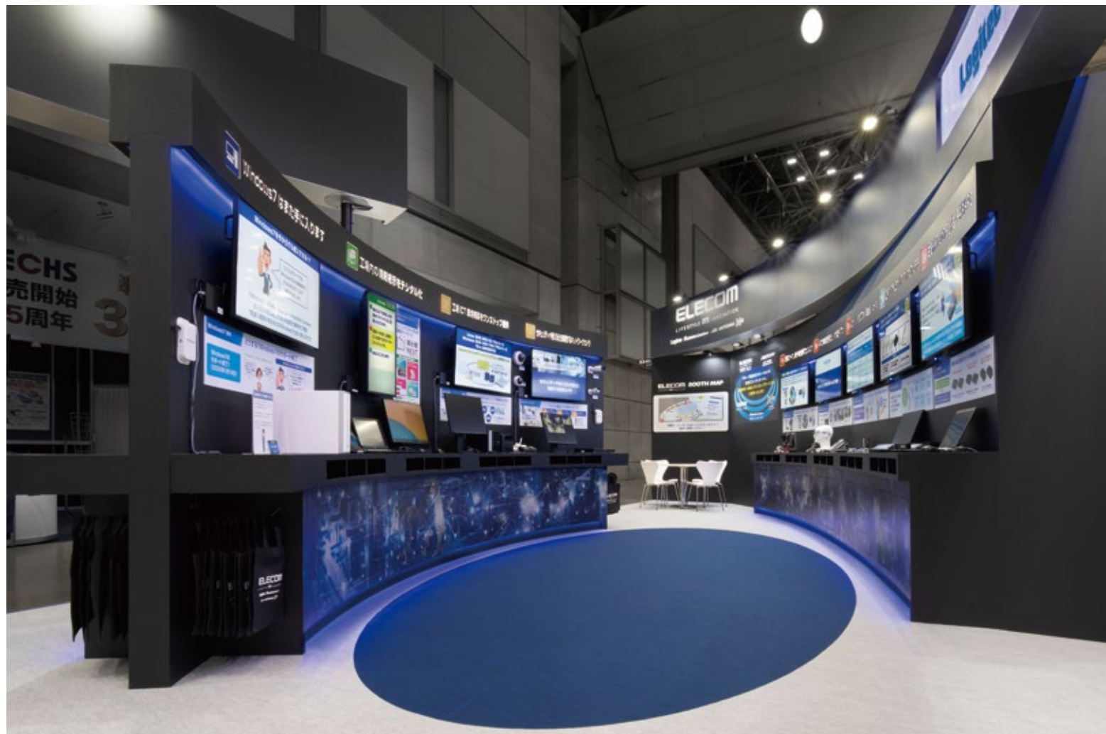
ソリューション提案（ひらめき）を卵に見立てた製品展示のコアスポット