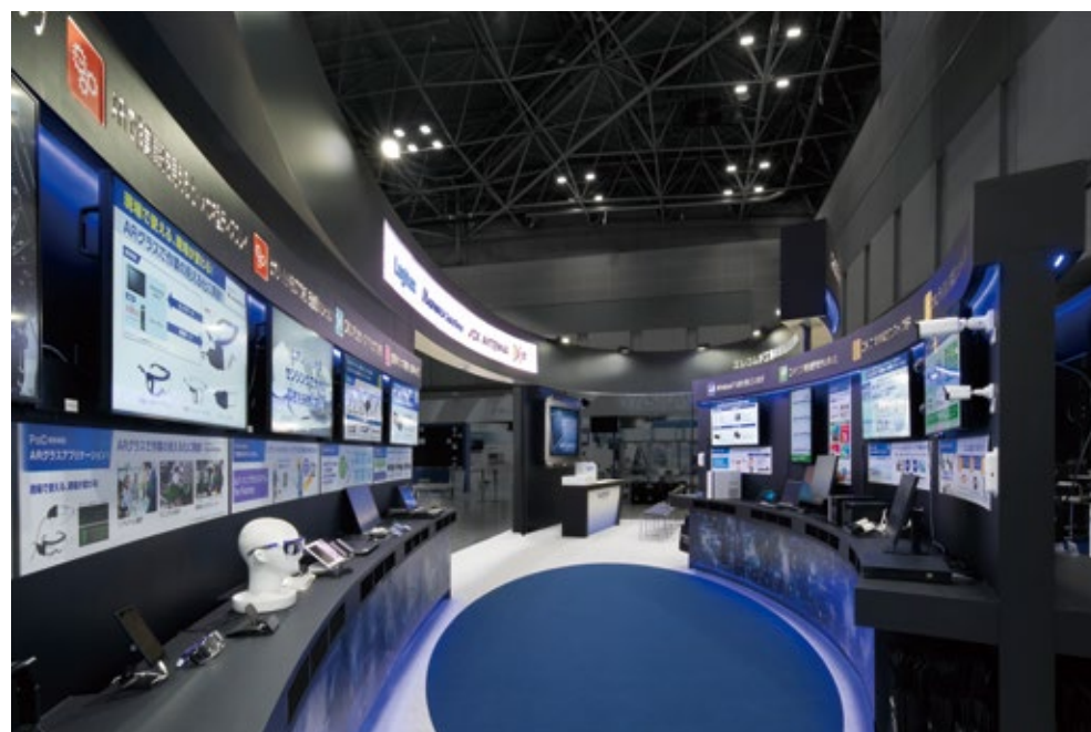
全方向へアプローチするサイネージ+テキストによるサイン計画