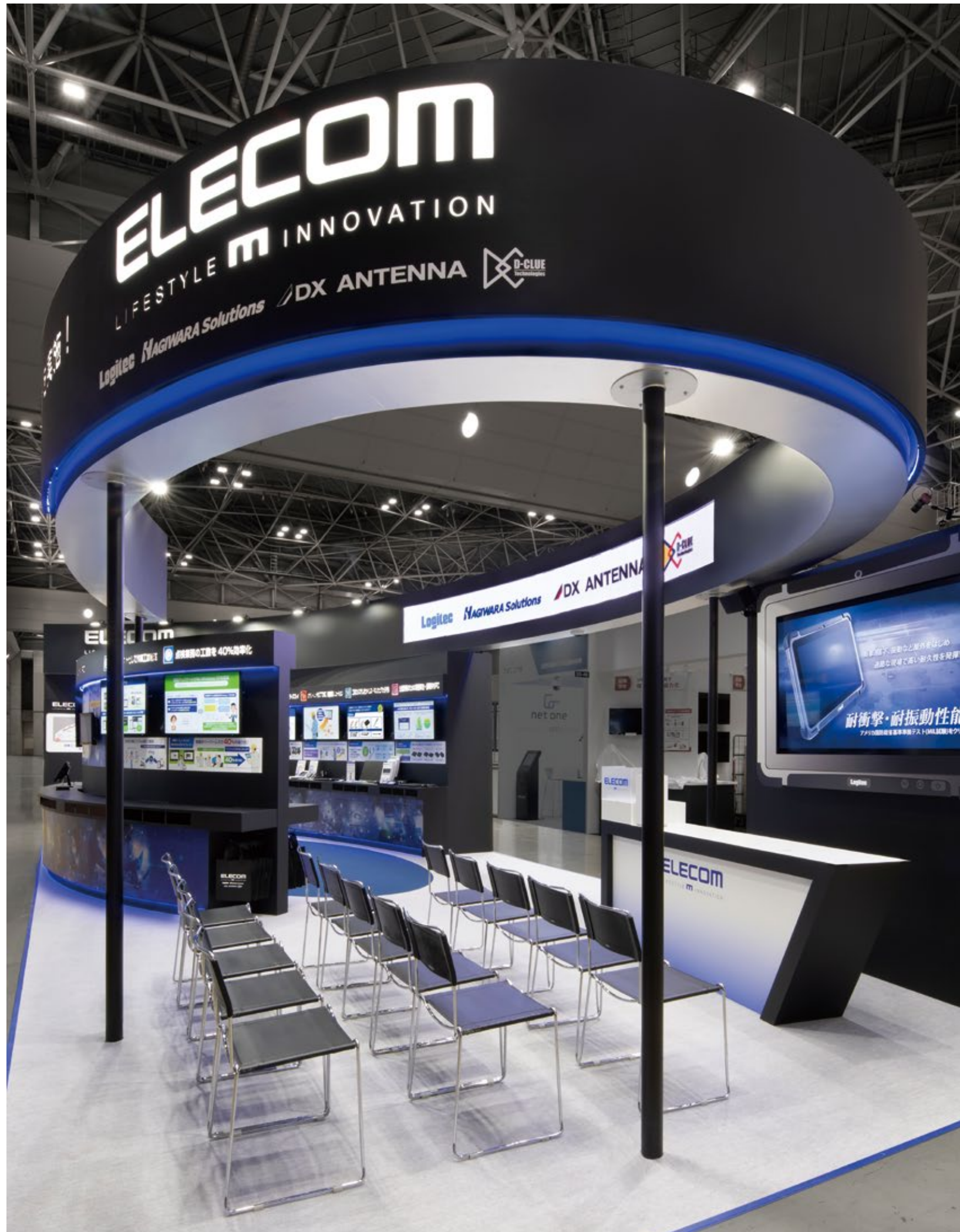
入りやすさとダイナミックな造形のコントラストが特徴